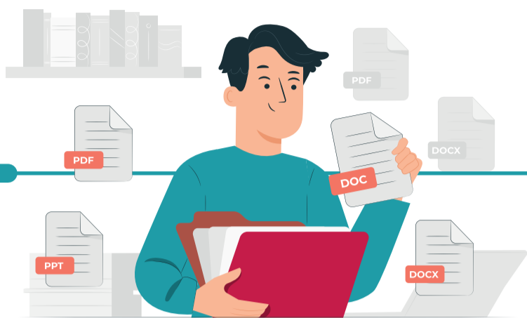
دریافت مدارک و تحویل به شعبه