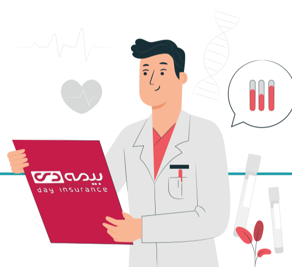
ارسال به پزشک جهت اخذ نظر