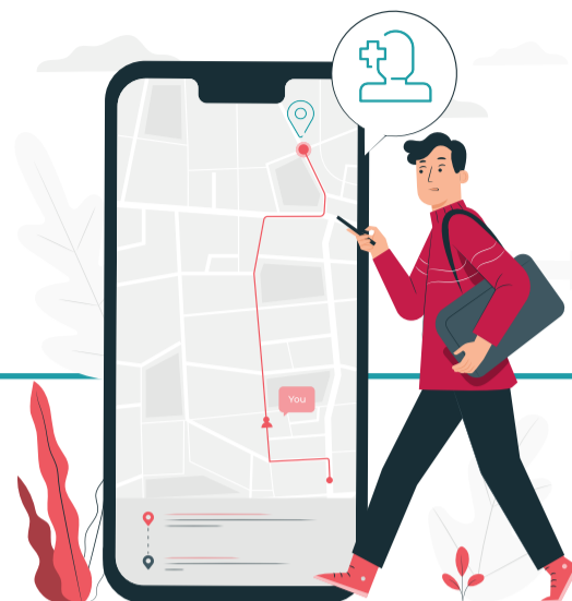
مراجعه به نماینده و اعلام خسارت